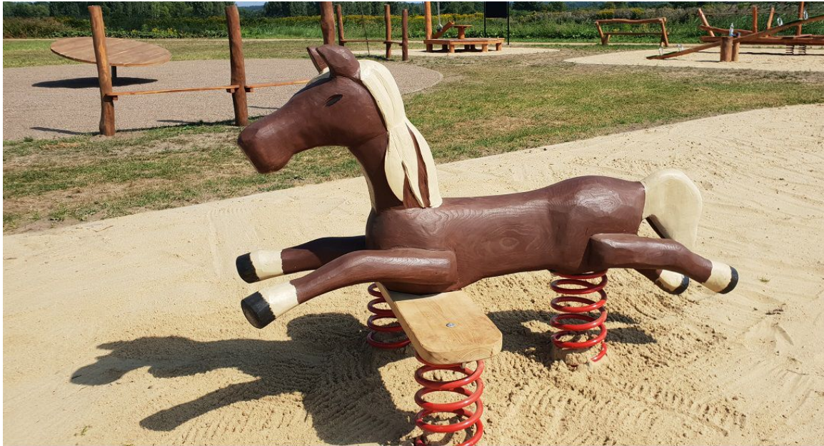
KONIK NA 3 -ch sprężynach